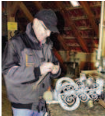
MIT Fingerspitzengefühl: Historisches Material wird aufgearbeitet.

Im November 2015 hatte der Verein einen vierseitigen Fragebogen mit dem Titel „Dein Talent ist gefragt“ an seine Mitglieder verteilt. Erklärtes Ziel war, allen die Gelegenheit zu geben, ihre Talente, Fähigkeiten und Kenntnisse in das Vereinsleben einzubringen. Mit dieser Aktion konnten nicht nur