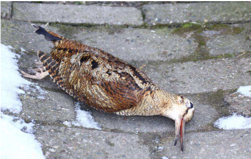
Tote Waldschnepfe.

Den Beweis, dass Schnepfen nicht nur bei der Jagd ums Leben kommen, lieferte eine Waldschnepfe, die in diesem Frühjahr an der Berliner Straße gegen ein Haus bzw. Fensterscheibe prallte und zu Tode kam. Scheibenanflüge sind die Haupttodesverursacher unserer heimischen Vogelwelt.