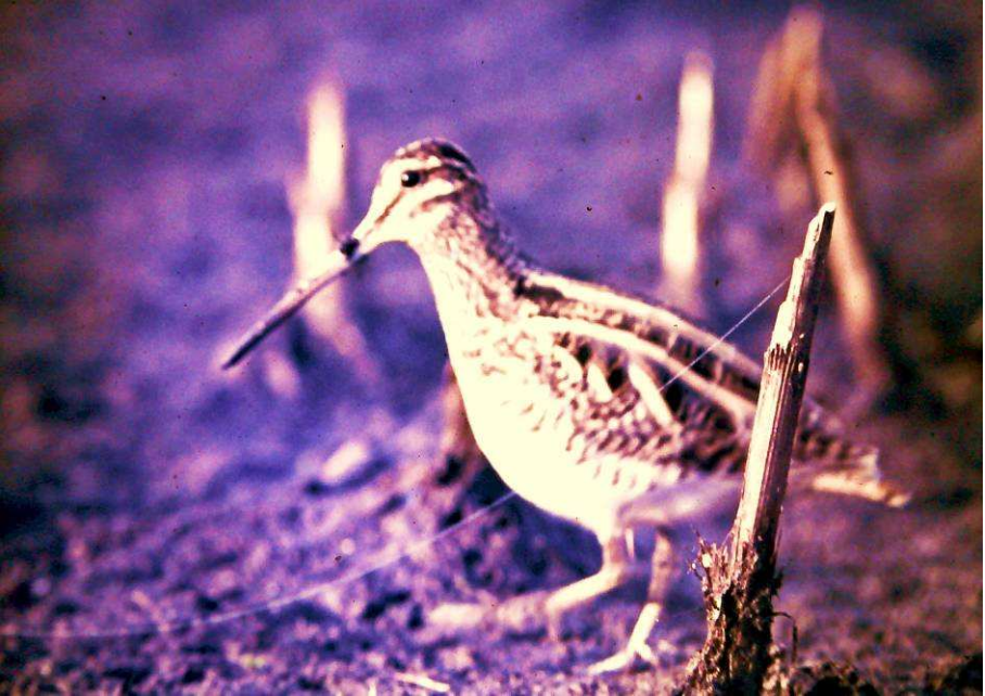
Bekassine ( Gallinago gallinago ) Vogel des Jahres 2013, Foto: W.Bruns