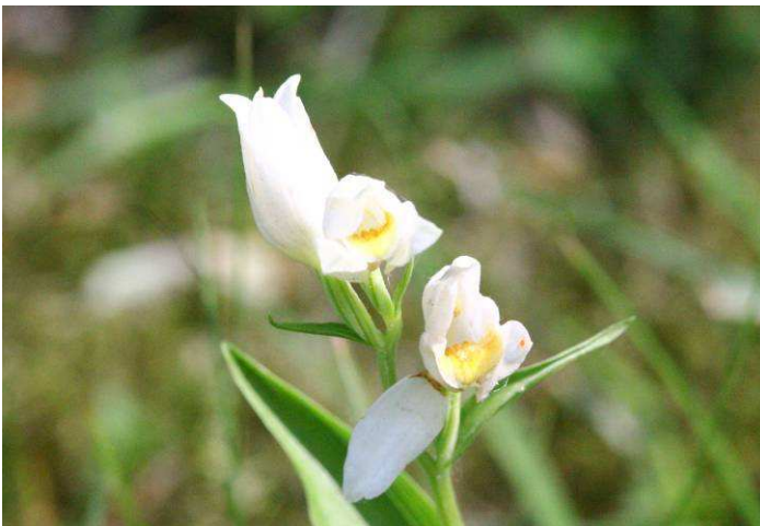
Weißes Waldvöglein ( Cephalanthera damasonium )

Leitpflanze die Margerite oder Wucherblume ( Leucanthemum vulgare ) auf, die dann ein paar Wochen als weißer Hauptblüher das Dreieck ziert. Ein botanischer Leckerbissen hat es mir hier aber besonders angetan: das seltene Weiße Waldvöglein ( Cephalanthera damasonium ). Es handelt sich dabei um eine Orchideenart, die unter das Artenschutzgesetz fällt und deren Beseitigung oder Abpflücken eine saftige Ordnungsstrafe nach sich ziehen kann. Aber welcher Ordnungshüter kennt sie schon. Ihre Entwicklung beobachte ich schon seit einer Reihe von Jahren. Aus zwei Exemplaren sind mittlerweile reichlich über 20 hervorgegangen und nur deswegen, weil unsere Ordnungsliebe an dieser Stelle die Natur in Ruhe lässt. Das Weiße Waldvöglein ist hier und da noch in Bissendorfs Wäldern zu finden. Aber schon recht selten geworden. Die überaus schöne und grazile enge verwandte, das Rote Waldvöglein ( Cephalanthera rubra ) ist schon seit mindestens vier Jahrzehnten in Bissendorf ausgestorben. Sie war immer schon sehr rar. Blicke zu hoffen, dass wir Menschen diesem kleinen Wuchsort an der Achelrieder Kirche weiter Verständnis entgegen bringen und ihn wie einen Augapfel hüten. Falsch verstandener Ordnungssinn lässt leider die „Rote Liste“ der Tier- und Pflanzenarten immer länger werden.