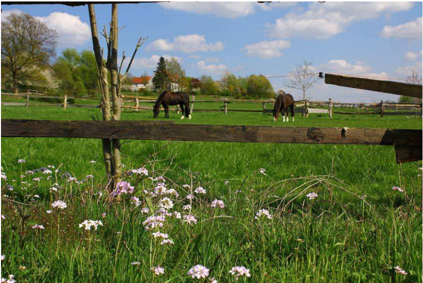
Mit der Schlehe blüht auch die Wildkirsche am Werscher Berg Pferde auf einer Weide in Ellerbeck.