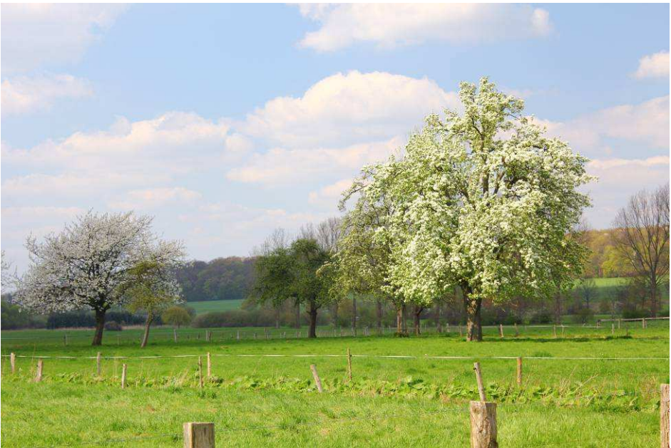
Blühende Obstbäume vor Himbergen.

van dat kabellose Telefon verlaarn. Ik weet nich, wonem ik dat malle Dings henleggt hebb. Wenn du nu bi mi anröppst, pingelt dat ja, denn finn ik dat ja sachst wedder.“ Un wenn du weten wullt, wi dat mit dat Radio löppt, denn segg ik di: „, Dat is all wat för de Katt! Dat Neemooodsche is nix mehr för ole Lüüd at mi. De Musik keem so luut ut den Apparat rutbölkt, datt mi bold de Slag drapen harr. Ik kunn den vermuckten Knoop to`n utmaken nich so gau finnen. Dor hebb ik eenfach dat Kabel ut de Steckdöös trocken. Dor weert ut! Gottloff un Dank!“ „Weeßt wat, mien Deern! Ik will op`n Stutz mien düütsch Dampradio wedder hebben, un ok dat ole swatte Telefon mit de groten Tallen to dreihn! Basta!“ „Ja, nu harrn wi den Salat! Un wi hebbt dat doch so goot meent!“