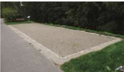
Abb.: Bouleplatz

Sie wurden unterhalb der Turnhalle aufgebaut, dort, wo sich der Aufgang zum Sportgelände befindet. Die Gemeinde Bissendorf legte weitere Anlagen an (z. B. Bouleplatz und Barfußpfad) und für Hunde entstand ein spezieller Parcours. Schließlich konnten dank einer Spende der Inoggy noch Straßenlaternen angelegt werden, die den Rundweg beleuchten.