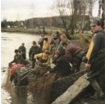
Abb.: Fische werden mit Netzen und Keschern an Land gezogen und in Containern lebendig zwischengelagert

Als Schwimmbad ist der See nur am Anfang und auch da nur selten genutzt worden.