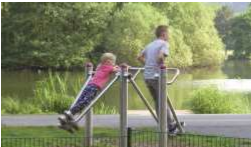
Abb.: Geräte laden zur Bewegung ein

Eine Initiative des TV Bissendorf-Holte, der Volksbank und des Heimat- und Wandervereins führte zur Installation von Geräten zur Bewegungsanimation.