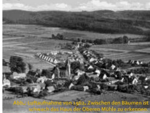
Abb.: Luftaufnahme von 1962. Zwischen den Bäumen ist schwach das Haus der Oberen Mühle zu erkennen.

Ein Bissendorf ohne den Sonnensee ist im Jahre 2018 fast nicht denkbar, so sehr haben wir dieses städtebauliche Juwel am östlichen Rande des Dorfes in unser Denken und Handeln einbezogen. Der See ist nicht nur den Ortsansässigen ein oft besuchter Erholungsort. Immer öfter trifft man Besucher aus der Stadt Osnabrück und aus dem Umland. Erwachsene und Kinder identifizieren sich mit ihm, beobachten die Tierwelt, registrieren Veränderungen. Menschen mit Behinderungen besuchen ihn täglich. Läufer umrunden ihn mehrfach. Die Bissendorfer Schule hat sich nach ihm benannt. Der See ist unumstrittener Bestandteil des dörflichen Lebens.