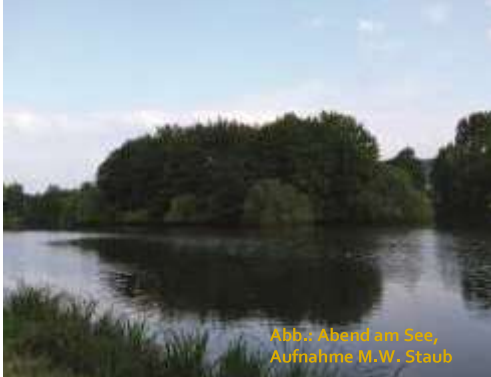
Abb.: Abend am See