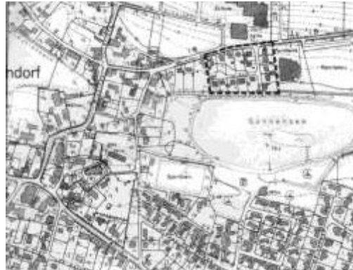
Abb. aus einem Prospekt: Ortsplan Zentrum mit See, etwa Ende des vorigen Jahrhunderts

bauung erschweren. Das frühere Niveau kann man heute nur noch an der Grünfläche des Sportplatzes erkennen. Das Niveau des Baches wurde unterhalb der oberen Mühle durch Dämme beiderseits hochgehalten, denn sein Wasser hatte ja noch die untere Mühle anzutreiben, wurde aber auch hier seit vielen Jahren nicht mehr benötigt.