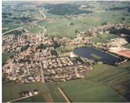
Abb.: Luftaufnahme mit See ca. 1980 – Die Bebauung der Sonnenseesiedlung auf dem Brömmelkamp ist abgeschlossen, die Herkunft der Aufnahme ist nicht bekannt

leicht an der Wahl des Namens ‚Sonnensee‘ beteiligt? 1 Auch der Bürgermeister Fridolin Dependahl könnte seinen Schulkameraden Theo beraten haben.